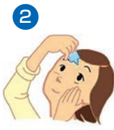
下まぶたを軽く引き、点眼する