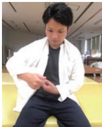
③ 麻痺のない腕を通す