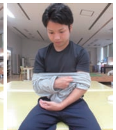
② 麻痺のない腕を通す