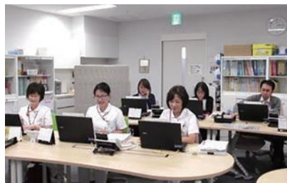
【在宅支援室の風景】

在宅支援室の役割は、医療や介護が必要な状態になっても、できる限り住み慣れた地域で、安心して自分らしい暮らしを続けることができるように支援することです。