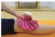
【氷のうで患部を冷却】

器械（アイシングシステム）だけではなく、患者さん自身も下肢の取っはけない姿勢を理解し、正しい位置にしておくことが重要です。看護師や療法士から説明をしています。