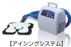
【アイシングシステム】

当院では冷却療法定用装置（アイシングシステム）を主に膝の前十字靭帯損傷の手術直後から1日目まで使用しています。術後2日目以降は、氷のうを使用して冷やします。