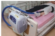
【アイシングシステムで患部を冷却】