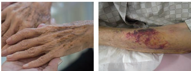
【皮膚裂傷が起こりそうな皮膚】

高齢者の皮膚は乾燥して、損傷を受けやすくなるため、健やかな皮膚を保つ為にもスキンケアが重要となります。